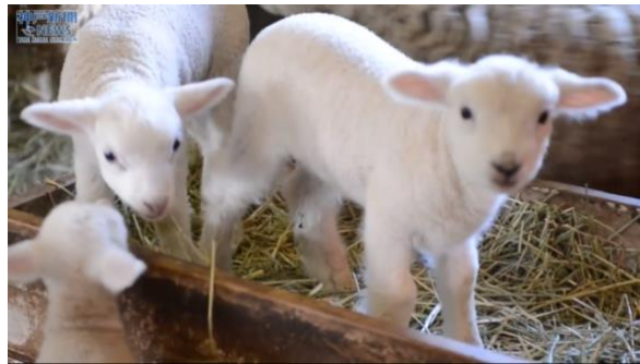
餌を食べている子羊たち

さて、ヘブル語を知るユダヤ人というのは、物凄い利点です。正直言うと、この言葉を知っていれば、物凄く多くの事が理解出来るのです。皆さんが天国に行った時には、あちらでヘブル語の授業を受けると思いますよ(笑)。皆さんが頑張っている間、私はコーヒーでも飲んでいますが(笑)。といっても、スターバックスじゃありませんよ、念のため(笑)。ただ、皆さんに言いたいのは、ヘブル語を知ると、その中には非常に多くの宝物が隠されているのです。一つ、簡単な例を言えば、「ささげ物」のヘブル語はコルバーン (קרבן)、これは、「近づく」とか「側に」と同じ語源です。その親密感が、御言葉の中にあるのです。彼らは、ただ子羊を取って、10分もかからず屠ったわけではありません。彼らは、子羊を自分たちの家の中に、第一の月の、10日目から14日目まで、4日間入れるのです。皆さん、小さな子羊を撫でたことはありますか？最も無害な動物です。