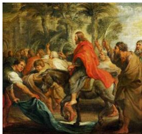
ルーベンス画 「キリストのエルサレム入城」

このように、ヨハネ 12章12~15節で、ゼカリヤ書9章9節が引用されています。そこで、人々は大声で叫んでいます。恐らく、彼らは分かっていなかったでしょうが、イエスは、書かれているとおりに「ろばの子を見つけ、それに乗られ」（ヨハネ 12:14）ました。彼は、はっきりと分かっておられました。非常に面白いですね。ルカ 24章44節で、イエスは弟子たちに言われました。