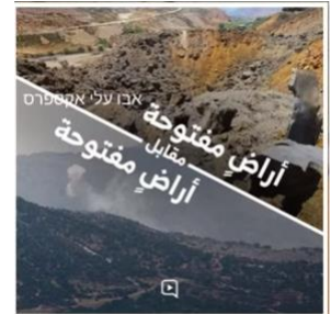
ヒズボラが各 SNS に投稿した写真

しかし、これらの写真を見てください。現在、ヒズボラは非常に不安なっています。2日前、彼らは、レバノンのベイルートで起こった、硝酸アンモニウムの巨大爆発から1周年を記念していて、あの爆発でほとんど破壊された穀物用倉庫の隣で行われた、この、大きなデモを見てください。しかし、その出来事