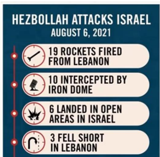
IDF がインスタグラムに投稿した内容