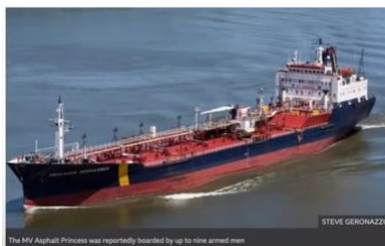
アスファルト・プリンセス号

では、ペルシャ湾に移りましょう。数日前に起こった事を、皆知っていますね。私は、ちょうどフェニックスを出た時にニュース速報で報告しました。湾岸で、イラン革命防衛隊がリベリアの旗を掲げた、大きな貨物船を乗っ取りました。ご覧の通り、アスファルト・プリンセスという名の船です。そして皆さん、あの銃撃犯は、この船をイランの海岸に持って行こうとしました。なぜか？ それは、イランは、身代金の要求や、お金の交渉に非常に長けていて、それが、現在の彼らの経済を助けますから。さて、米国の船と、オマーンからオマーン空軍の船が到着す