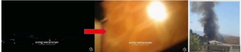
レバノン南部への、イスラエルの空爆(写真左、中央)と、イスラエル北部での火災(写真右)

預言者に祈って、そして眠れ。誰もが、これはばかげていると考えました。それは、ヒズボラの弱さと、新たな前線に対応できないヒズボラ政権の不能を示し、露呈しました。ところで、レバノン南部への空爆の様子を映した動画をご覧になりたい方、一つあるかも知れません。真夜中のもので、人々はただ爆発を見て、そして困惑し、そして、何が起きているのかを、理解しようとしています。すると、新たに爆発が起って、全体をバラバラに打ち砕き、カメラが揺れます。ご覧ください。これが2日前に起こった事です。そして今朝、皆さん、もちろん、ご覧いただいたこの映像は、3日前のもので、着弾したロケットによって、イスラエル北部で火災が発生、感謝な事に、死傷者は出ませんでした。しかし、そのために、何エーカーにも及ぶ森林と植物が、燃えました。