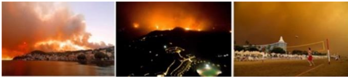
トルコの大火災。炎が観光地を襲っている。

トルコからの悲しいニュースです。恐らく、このために、エルドアンの声が聞こえないでしょう。ここ数日、または数週間、トルコ南西部で、大規模な火災が起っています。マルマリスと、ボドルムのホテルがある地域全体です。