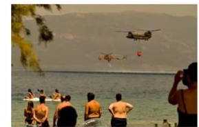
オリンピアでの火事

もちろん、それだけでなく、アテネの周辺でもまた、オリンピック発祥の地、オリンピアで大きな火災が起きています。これは、ギリシャの島々の海岸です。イスラエルは、ギリシャを助けることを約束し、こうして話している間にも、助けを送っています。