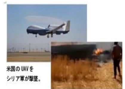
米国の UAV を シリア軍が撃墜。

また、米国の UAV（無人航空機）の報告もあります。これは、非常に強力なものです。ご覧ください。非常に精巧なもので、それが、シリア軍によって撃墜されました。動画を持っていたと思います。はい、はっきり分かる通り、この時、彼らは UAV で、地域に近づき、実際に撃墜しました。そして、彼らはそれを祝っています。「見ろ！我々は、アメリカの UAV までも撃墜した！」