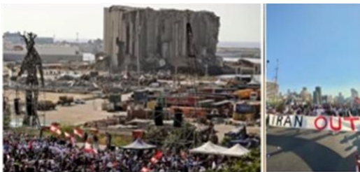
ベイルート大爆発から一年、ヒズボラに対する

の写真をみると、彼らが、このすべての責任を誰に問い、レバノンから誰を追放しようとしているか、見てください。そうです。「イラン、出て行け！」ところで、彼らが「イラン、出て行け！」と言うとき、彼