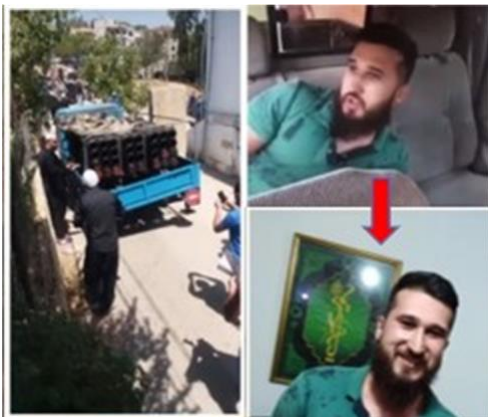
ドゥルーズに捕えられたヒズボラの手下は、

さて、今朝は、19発ロケットの集中砲火です。IDF が、インスタグラムに投稿した内容をご覧ください。