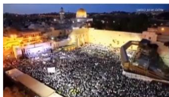
フラッグパレードの大群衆

旗だけです。私たちは、人を撃ったり、殺したり、殴ったりしていません。私たちは、命を祝っています。死ではありません。私たちは平和を祝っています。破壊ではありません。私たちは、エルサレムの再統一を祝っています。エルサレムの分裂ではありません。これで足りないなら、毎年行われるこのパレードの最終的な一致は、何万人もの行進者が壁に来たときです。皆さん、この動画をご覧ください。これは非常に驚くべきことです。見