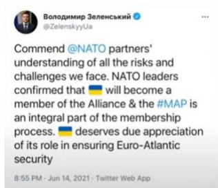
ウクライナ大統領のツイート

それだけではありません。数日前のツイートを見てください。ウクライナの大統領がツイートしました。彼が言ったことを見てください。