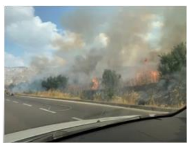
ハマスの風船爆弾により、 南イスラエルの農地が

た。ハマスが、イスラエル南部に向かって飛ばしていたのです。彼らのしている事を見てください。彼らは、風船の定義を新しくしました。誕生日パーティーではありません。皆さんが見ているものは、子供や喜び、お祝いとは何の関係もありません。これは、破壊と死をもたらし、イスラエル南部の畑や農地を燃やすためです。イスラエルは、ハマ스에警告しました。