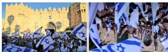
西壁でフラッグパレードを祝うイスラエル人

イスラエル新政府の、最初の試練がありました。つまり、戦争のために延期された「フラッグ（旗）パレード」です。覚えていますか？1ヶ月前のガザとの戦争は、エルサレムのフラッグパレードの日に始まりました。それが、数日前に、我々がした事を見てください。数えきれないほどのイスラエル人が、旧市街の壁に押し寄せました。見てください。