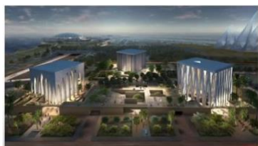
アブダビ「アブラハムの家族の家」

しかしまた、私はリーダーシップのこの危機を目にし、また私は、イスラムのテロリストや過激派の怒りを見ていて、彼らは、それが終わりであることを知っています。私たちが今見ているのは、新しい世界宗教に向けてギア