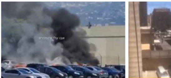
ガソリンの奪い合いや発砲が起きている

燃料さえ十分にありません。この動画を見てください。完全な混乱と無政府状態です。ガソリンスタンドに来て、自分たちが望むものを得られないと彼らは発砲し始めるのです。ところで、この動画の中で、車のトランクに入っていたガソリンに火がついています。みんな、ガソリンを車に保管しているのです。次の動画を見てください。音声を再生すれば、暴力が勃発してい