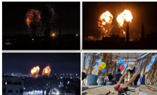
イスラエルによる、ハマスの攻撃(上2枚と左下)と 風船爆弾を作るハマスのメンバー(右下)

それでは、ニュースに飛び込みましょう。まず第一に、昨夜、私はローマからルーマニアに移動中でしたが、あまり眠れませんでした。ガザで多くの行動があったためです。昨夜、イスラエルはガザで攻撃を行いました。おそらく、我々の Hamas との間の停戦以来、最も激しいものだったと思います。我々は、民間と軍の両方で、Hamas のインフラを破壊し、地下ロケット打ち上げを破壊し、前哨基地を破壊し、いくつかの監視点を破壊しました。見てください。Hamas は、イスラエルの攻撃のあまりの激しさに、非常に驚きました。さて、あなたは思っているでしょう。「なぜ、イスラエルは攻撃したんだ？」それは、基本的に、一連の“火の風船”の後でし