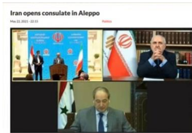
イラン、シリア・アレッポに領事館開設

では、シリアを見てみましょう。イランは、シリアでも拡大し続けています。彼らは、先日、アレッポに領事館を開設しました。間違えてはいけません。アレッポの領事館は、アレッポ市のイラン諜報のもう一つの腕です。非常に興味深い事に、イランは、非常に多くのことに投資しています。イランは、シリア国内で契約を締結しています。道路、学校、食べ物、非常に多くの事で。彼らは、シリアを自分のものにしたいのです。彼らが、イラク、イエメン、レバノンでやっているのと同じように、今、彼らは、シリアに同じことをしようとしています。非常に悲しい事です。