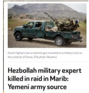
ヒズボラの軍事専門家がマリブの空襲で死亡。

では、続けましょう。このように、イエメンは、イランとその代理によって続けて支配されていて、つい先ほど、マリブでの襲撃で、ヒズボラの軍事専門家が殺害されたと聞きました。マリブは、イエメンの本当の政府がまだ支配している都市です。しかし、石油が非常に豊富なので、フーシ派のアル・アンサールがそれを狙っていて、そして、マリブでのその戦いで、ヒズボラの専門家が死にました。さて、イラン系レバノン人の男が、専門家としてイエメンで何を行っているのか？イエメン国内の、あちらでの戦争で、イランを代表しているのではないのですか？イエメンはまた、引き裂かれています。皆さん、私は、イエメンから発信されている非常に多くのものを読んでいます、本当に心が痛みます。女性は性奴隷にされ、殺され、投獄されています。現在、彼らが行っているのは、女性を連れて来て娼婦にし、それらの娼婦に、偵察機を持たせて、フーシ派に反対する人の家にそれらの機器を取り付けさせているのです。彼らは、それらの女性を利用して、もし女性がノーと言うなら、その人は、理由もなく刑務所に投げ込まれます。本当に心が痛みます。子どもたちは餓死しています。なぜなのか？なぜなら、フーシ派は人々の世話をしたくないのです。彼らには、たった1つの役割があるのです。そのことについては、この後「最後のジハード」の話の時に、お話しします。