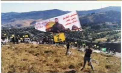
ヒズボラ、国境でイスラエルに抗議

のトップが、パリを訪れているのが見えます。彼は、フランス側の相手を訪問していて、だから、フランスの参謀総長と、レバノンの参謀総長がいます。そして、彼が言ったことの一つは、軍隊は倒産している。我々には食べ物がなく、我々には電気がない。我々は、破綻している。そして、フランスは言いました。私たちが、あなたに食べ物を送り、私たちが、あなたにガソリンを送り、私たちが、あなたを助けましょう。レバノンは破綻しています。なぜか？それは、ヒズボラがそこへ支配していて、レバノンを助けようとする、あらゆる働きを妨げているからです。なぜなら、彼らは、政治の場から追い出されたくないからです。そして、下に見えるのは、ヒズボラが、フェンスで、イスラエルに対して抗議しているのが見えます。皆さん、レバノンの土壌と、フェンスの反対側のイスラエル側の土壌の違いを、注意深く見てください。イスラエル側には青々と植物が繁っていて、そして、レバノン人がいる方は、非常に乾燥した荒地です。ガザでのイスラエルの軍事作戦が、すっかり