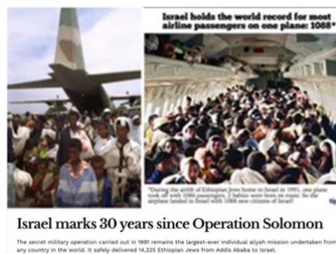
イスラエル、ソロモン作戦から 30 周年！

数日前、ソロモン作戦から 30 周年を迎えました。ソロモン作戦は、イスラエルが 1991 年 5 月 24-25 日の 36 時間以内に、私が間違っていなければ、35 機です。私たちは、空軍 C-130 や、エル・アル・ボーイング 747 を含むイスラエルの航空機を使用して、14,325 人を運びました。ところで、私たちは世界記録を保持しています。747 ジャンボ・ジェット機の機体に、私たちは 1,086 人の乗客を詰め込み、途中、2 人の赤ちゃんが生まれて、飛行機は 1,088 人を乗せて着陸しました。写真をご覧ください。左側が C-130、右側がボーイング 747 です。イスラエルは、地球の四隅からユダヤ人を連れ戻しています。まさに、イザヤ 11 章が告げる通り、彼らは、はるか地球の四隅から戻って来ています。こんにちのスーダンとエチオピアである、クシュの地域からも。これは本当に特記すべき事です。だから、私たちが殺そうとする者たちが絶望的な敗北をなし、そして去って行く間、私たちは、ユダヤ人を故郷に戻す事に勤しんでいて、そうすることで、私たちは驚異的な方法で、聖書預言を成就しています。