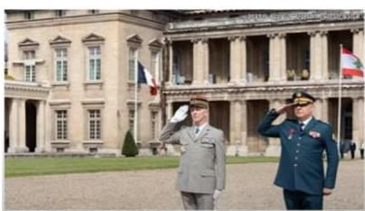
レバノンの軍幹部、パリを訪問

さて、レバノンに移りましょう。レバノンに関連する写真が2枚、画面上に出ています。上は、レバノンの軍