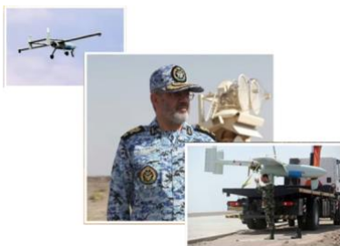
イラン空軍の軍事演習