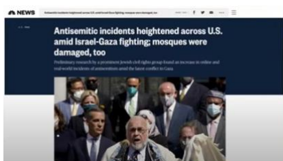
「イスラエルとガザの戦闘中、全米で反ユダヤ主義者の事件が増加、モスク(シナゴーク?)も被害を受けた」

も反ユダヤ主義が大きく高まっているのです。パレスチナ人の暴徒が、町中を運転してユダヤ人を探し出して、バットや何かで、ユダヤ人に暴行を加えています。彼らはそれをニューヨーク市で行い、フロリダで行い、カリフォルニアでも行っています。彼らはまた、ヨーロッパ全体でそれをしていて、私たちはそれを見ています。私がそれを言った理由は、彼ら自身の指導者達の無能さのために、彼らがそこを去りたいと思っている最中、イスラエルは、ユダヤ人を故国に連れ戻すのに大忙しだからです。