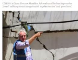
「ガザ攻撃に関する UNRWA 所長の発言をパレスチナグループが非難」

News | CNN Palestinian groups slam UNRWA director's comments on Gaza attacks