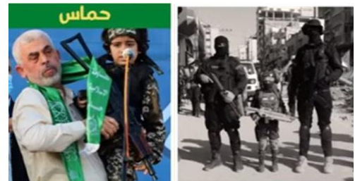
子どもたちがハマスの犠牲者となっていく

この後、それについてお話ししますが、ただ、皆さんには、この全体がいかに残忍であるかを見て欲しいのです。そして、彼らが、どのように人々を洗脳し、本当に勝利したように見せているか。彼らは勝利していません。しかし、彼らは今、子どもたちを利用して、彼らは、大人のサポートをすっかり失いましたから。