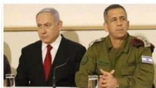
ネタニヤフ首相（左）と ガンツ国防相（右）

イスラエル前線では、念のために言いますと、ベンジャミン・ネタニヤフ首相、軍の指導者と国防相に対して、イスラエル国民からの、前代未聞の支持があります。一つ、言わせてください。他の候補者が組閣命令を受けたことで、ベンジャミン・ネタニヤフは非常に弱体化され、新政権が出来て、ベンジャミン・ネタニヤフは首相ではない、というのが、ほとんど決まったかのように見えました。ところが、これが起こった瞬間、すべてが変わりました。ヤミナ党（ナフタリ・ベネット率いる右派政党）は、左派と政権を樹立することは、今のところ実現不可能であると判断しました。そして今、ネタニヤフの選択肢は、自身で政府を形成するか、第 5 回目の選挙に立候補するかで、これまで以上に有利です。ですから、かなり驚きです。ところで、すべての主要なイ