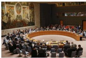
国連・安保理事会