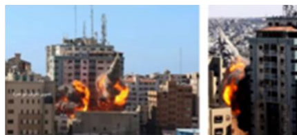
テロリスト関連のビルを破壊

さて、非常に明確にさせてください。私たちは、ただビルを崩すだけではありません。私たちが崩したビルは、ハマスと直接関係があって、彼らがビルにいたのは、イスラエルがビルに触れないと彼らが確信していたからで