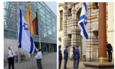
ドイツ(左)とチェコ共和国(右)

では皆さん、シャローム。アミール・ツアルファティです。また一緒できることを、とても楽しみにしています。通常、私は日曜日にはアップデートをしません。私は、日曜礼拝を尊重しますから。実際、皆さんの多くが、後でこのアップデートをご覧になると確信しています。ただ、中東の出来事は、日曜日であろうと月曜日であろうと、全くお構いなしで、フルスピード、フルスイング、まさにノンストップで続いています。ですから、アップデートをした方が良かったのです。皆さんの多くは、テレグラムで私をフォローされていて、私は毎日、そこに動画や写真や情報をアップしていますが、ほとんどの人はまだテレグラムをご覧になっていないようです。そして、多くの人々が欺瞞に晒され、多くの人々が周辺の偽情報や、ゴミの多くに晒されています。そこで私は、すべてをまとめることに決めました。かなりの数の人が、前回の私のアップデートをとって、独自の解釈をしています。真実が世界中で聞かれている限り、私のアップデートから物事を取り出しても構いません。すべては主の栄光です。