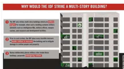
破壊されたビルの中の、ハマス関連のオフィス

す。さて、彼らがエルサレムとテルアビブに、あのような事をした後私たちが、本気を出し、そして、ガザの中で、一ヶ所として、彼らにとって、安全な隠れ場を残さないと決意しました。それらの“ビル”が、どのような様子であったか、見てください。これが、ただの“罪のないビル”ではないことが分かるでしょう。私たちが倒した、メディアタワーでさえ、AP 通信と、アルジャジーラが入っていました。これらの通信社は、ハマスの職員や事務所がその建物のあちこちにいることを、知っていました。実際、私は彼らが彼らと協力していたと信じています。だから、皆さんが今スクリーンに見ているビルは、二次的被害を出さず崩壊するように、ビルの下に数発のミサイルを発射したのです。その下の建物は、一棟も破壊されませんでした。かなり凄い事です。私はロケットの写真を持っているのですが、それが下から取り壊されたとは思わないでください。そうではありません。しかし、皆さんに理解してほしいのは、