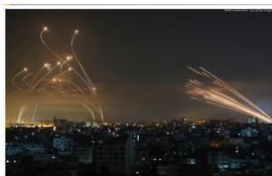
アイアンドーム(左)と ハマスのロケット弾(右)

まさにとのために、閣議は前進する決断に至ったのです。停戦も、イスラエル軍の活動停止もなく、前進する。皆さんは、これを理解しなければなりません。この作戦の有名な写真の一つは、片側でハマスのロケットが飛び、