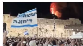
エルサレム・デーで踊っているユダヤ人の隣で、パレスチナ人が放火