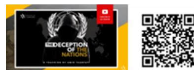
「諸国の欺き」サムネイルと、日本語版 QR コード （スマホなどのカメラで読み込むと、

繰り返しますが、それは悲しい現実だと言わざるを得ません。翌日はどうなるのか。この軍事作戦の翌日に、何が起るか？彼らが、自分自身に招いた、この不必要な戦争の翌日？ゼカリヤ書 2章 8~9 節は、告げています。