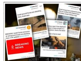
イスラエルの「操り」に、 一斉に反応した国際メディア

ヘブライ語では「すぐれた指揮」は、“優れた指揮”ではなく、ヘブライ語のその言葉は「操作」です。言い換えれば、敵にこちらが考えさせたいように考えさせておいて、こちらは何か他のことをするのです。さて、私たちはどのようにそれを行ったか？イスラエル軍報道官は声明を発表して、イスラエルは空中作戦と地上作戦の両方を行っていると言いました。するとなんと、すべての国際メディアがすぐに報道したのです。そのうちのいくつかを見てください。国際メディアが報じた記事のスライドです。見てください。ニュース速報。