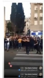
アラブ版 ANTIFA か？

ところで、この「ナチス・パレスチナ主義」は何も新しいものではありません。これは、ナチスがドイツの党として本