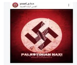
「パレスチナのナチス」とタグ付けした、とあるパレスチナ人のFB写真