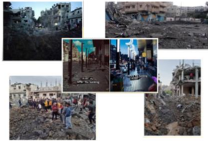
瓦礫の山となったガザの街

神はイスラエルのためにそこにおられ、主はイスラエルの破壊を狙う者に対して、ご自身のこぶしを振り上げます。そういう事です。そして、すべてが終わる時、ガザに何が残っているか、見てください。破壊を見てください。これを見てください。これは、ガザのメインストリートの爆撃前の様子です。そしてそちらは、今の様子。