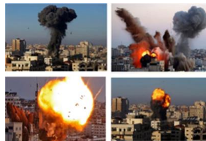
イスラエルの、対テロリスト作戦

それでイスラエルがした事を見てください。35~40分以内にイスラエルは、160機の戦闘機で450トンの爆弾を投下、6つの異なる基地、12の異なる飛行隊から来る戦闘機で、まさにその場所全体を吹き飛ばしました。