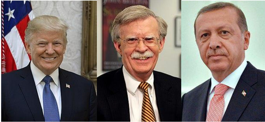
トランプ米大統領（左）とジョン・ボルトン国家安全保障担当大統領補佐官（中）とエルドアン土大統領

興味深いことに、イスラエルは、5月、早期選挙に入ります。通常は11月ですが、早期選挙では、数ヶ月早く行われます。そしてアメリカは、2年後に大統領選を控えています。