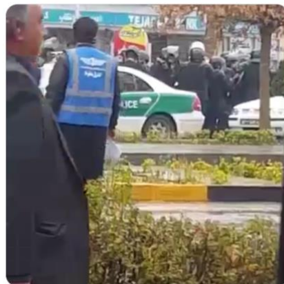
教師と教育家たちの抗議集会を伝えるツイッター

Teachers&educators gathered in protest against the low wages&officials' neglecting their demands. pic.twitter.com/HpxfTiKUVs #IranProtests