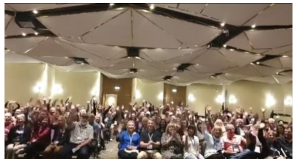
Figure 1 熱狂的な 240 人の人々！