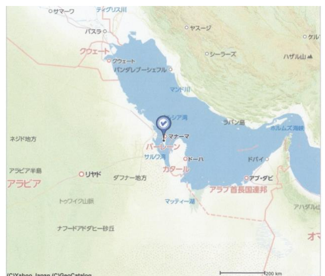
Figure 4 バーレーンの位置