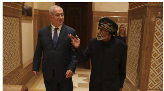
Figure 5 オマーンのスルタン・カブーズと談笑する ネタニヤフ首相

なので、私が強調しておきたかったのは、エゼキエル 38 章、特に 13 節の重要さです。