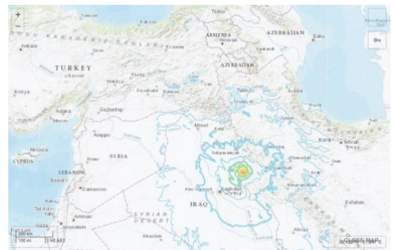
Figure 2 地震の震源地

ですから、イスラエルは非常に大規模な地震を経験します。そしてそれは、神がイスラエルの敵に勝利する方法の一部です。