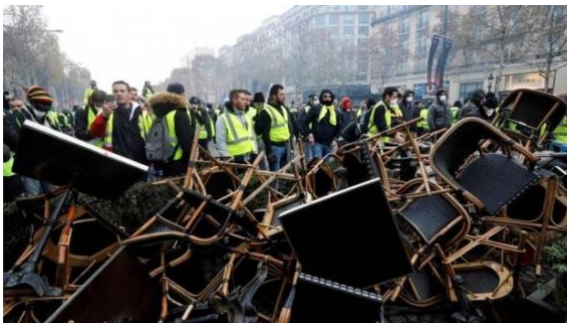
シャンゼリゼ通りを埋め尽くすデモ隊

彼は、実は、ガソリンに対する政府の補助金を減少して、フランスを緑化しようとしているのです。言い換えれば、ガソリン価格が上昇し、生活費が上昇、皆が、それに対して辟易としているのです。フランス人達は、それにうんざりしています。そのため、シャンゼリゼ通りでは多くのデモが起こっていて、昨日は、多くの炎や警察、まるで実際の紛争地帯のようでした。ですから、ヨーロッパでは多くの大混乱が起こっています。