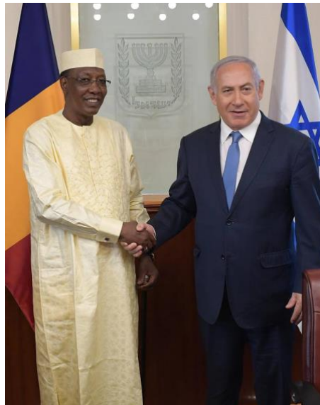
チャドの位置（左）と、チャドの大統領と会談するネタニヤフ首相（右）

ただ、私が今日知って驚いたのは、チャドは北はリビア、東はスーダンと国境を共にしているのです。だから、彼らは、イスラエルとの繋がりを望んでいて、我々は、彼らがりビアとスーダンからやって来る反政府勢力から防衛するのを手伝っているのです。そしてなんと、スーダンはそれが気に入らず、リビアもそれが気に入りません。面白いと思いませんか？