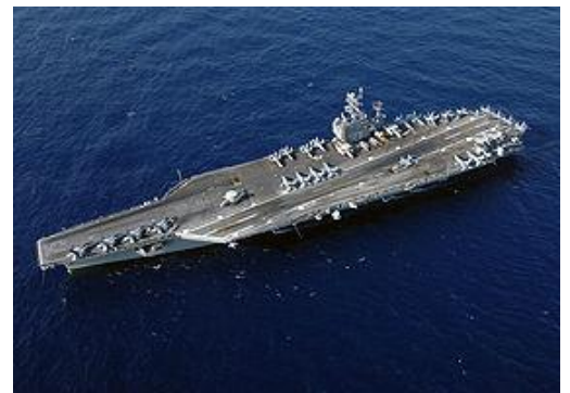
Figure 6 空母ハリー・S・トルーマン

【アミール】そう。「はいはい。“最後に一つ”ね。」って、こう言ってたよ。(会場爆笑！)