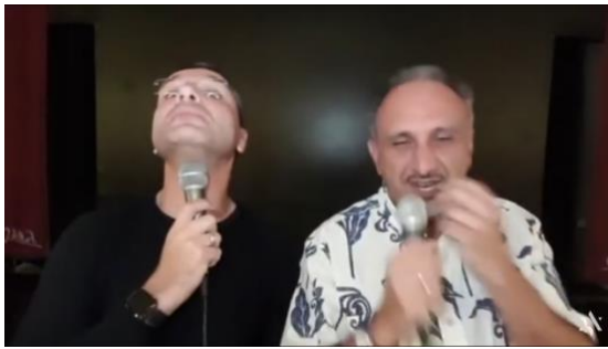
おちゃらけるお二人

すみません。(笑)皆さんは、私達がここでどれ程楽しんでいるか、想像も出来ないと思いますよ。もう、犯罪です。本当に。