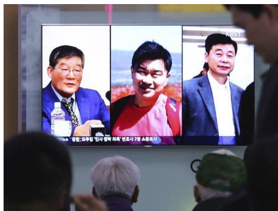
北朝鮮に拘留されていた3人のアメリカ人