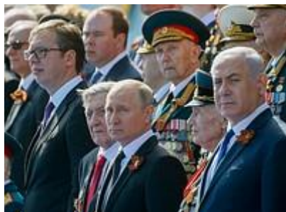
軍事パレードに出席するプーチン大統領（中央）とネタニヤフ首相（右端）

イランは物凄く孤立していて、アラブ界も、ヨーロッパも、アメリカも、ヴラディミール・プーチンでさえ、彼らの味方ではありません。プーチンは昨日、ベニヤミン・ネタニヤフを招いて、ナチス・ドイツに勝利したことを祝う、ロシア国内で最も重要な式典に彼を招待し、世界中の指導者たちが受け得る栄誉の中で、最高のものを彼に与えたのです。